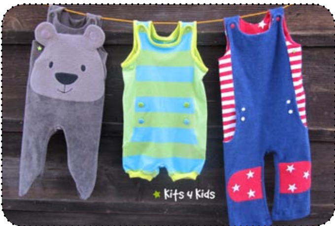
Kiki Krabbelhose - Trägerhose

Den Knoppullover wird es übrigens auch demnächst als Kindervariante geben! Lass´ dich überraschen!