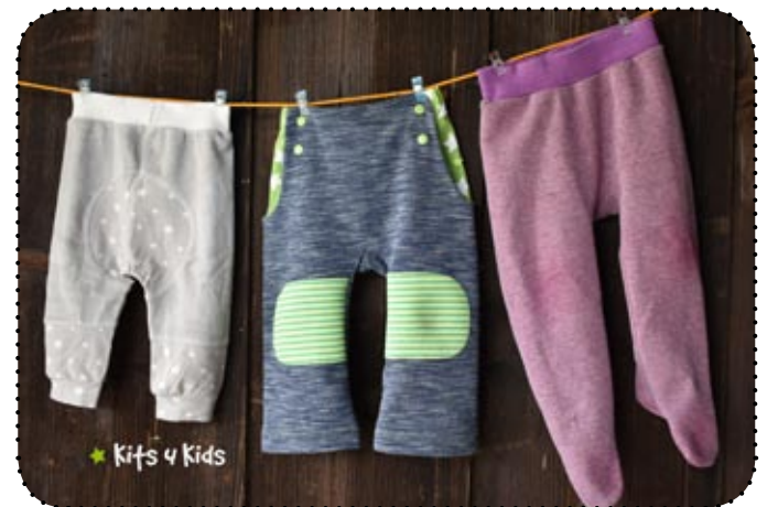
Kiki Krabbelhose - Bundhose