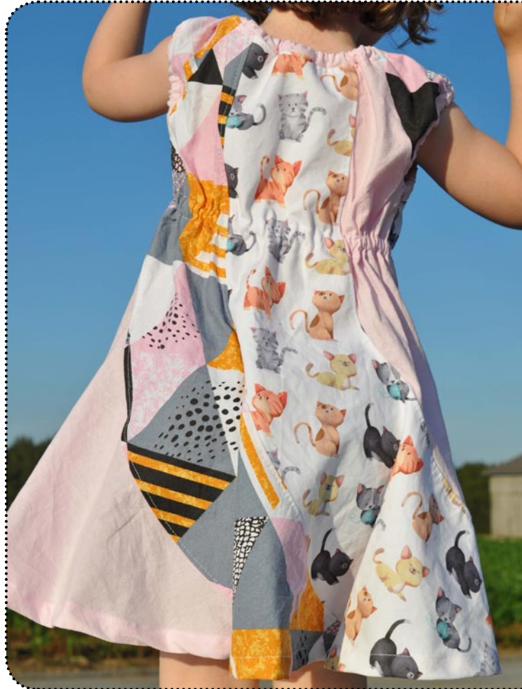
Größe 98 gekürzt - Weite 86, Webware