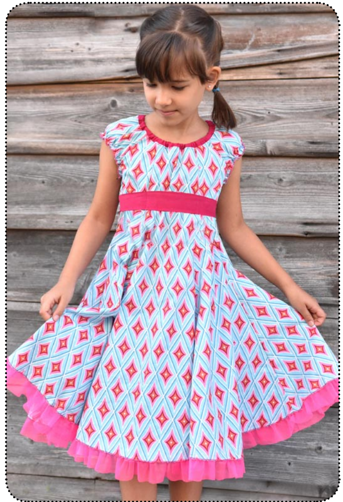
Miss Holli Drehkleid mit geraden Rockbahnen

So wird das Miss Holli Drehkleid zum idealen Kleid für den 1. Schultag oder ein schickes Sommerfest!