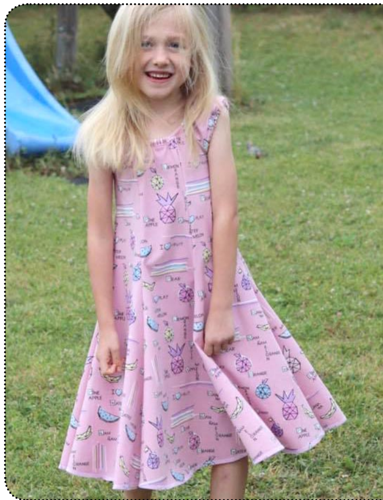
Größe 122 - Weite 104, Jersey