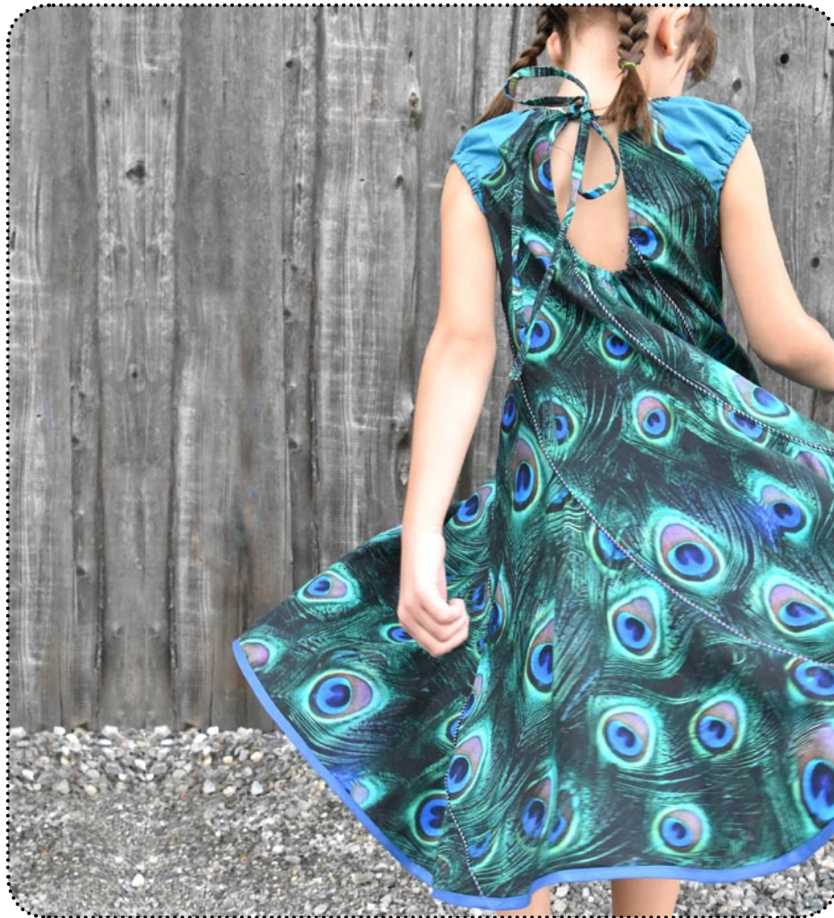
Miss Holli Drehkleid mit Tropfenausschnitt