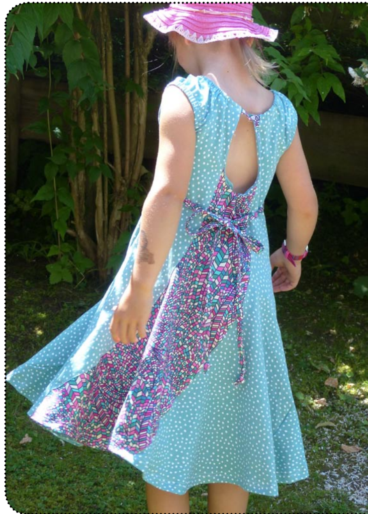
Größe 128, Jersey