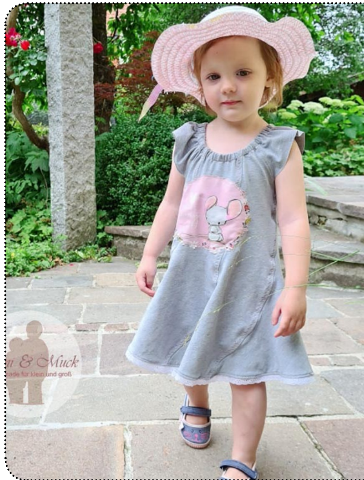
Größe 86 gekürzt, Jersey