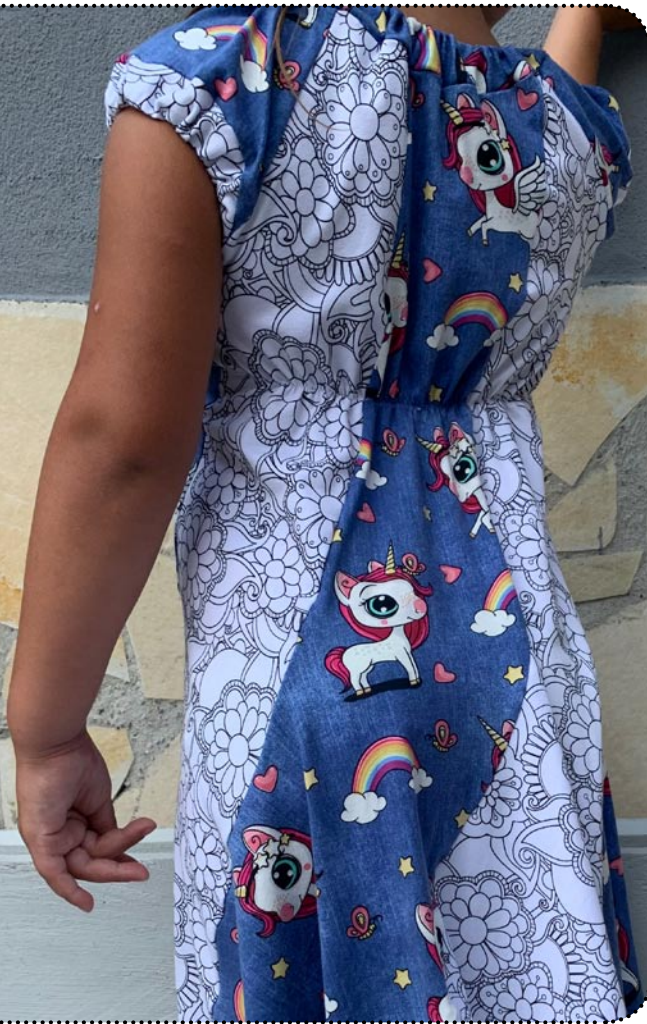
Größe 140, Jersey