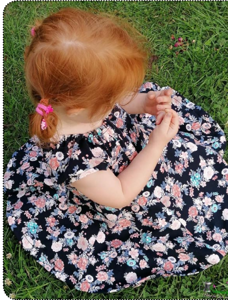
Größe 104 gekürzt, Jersey