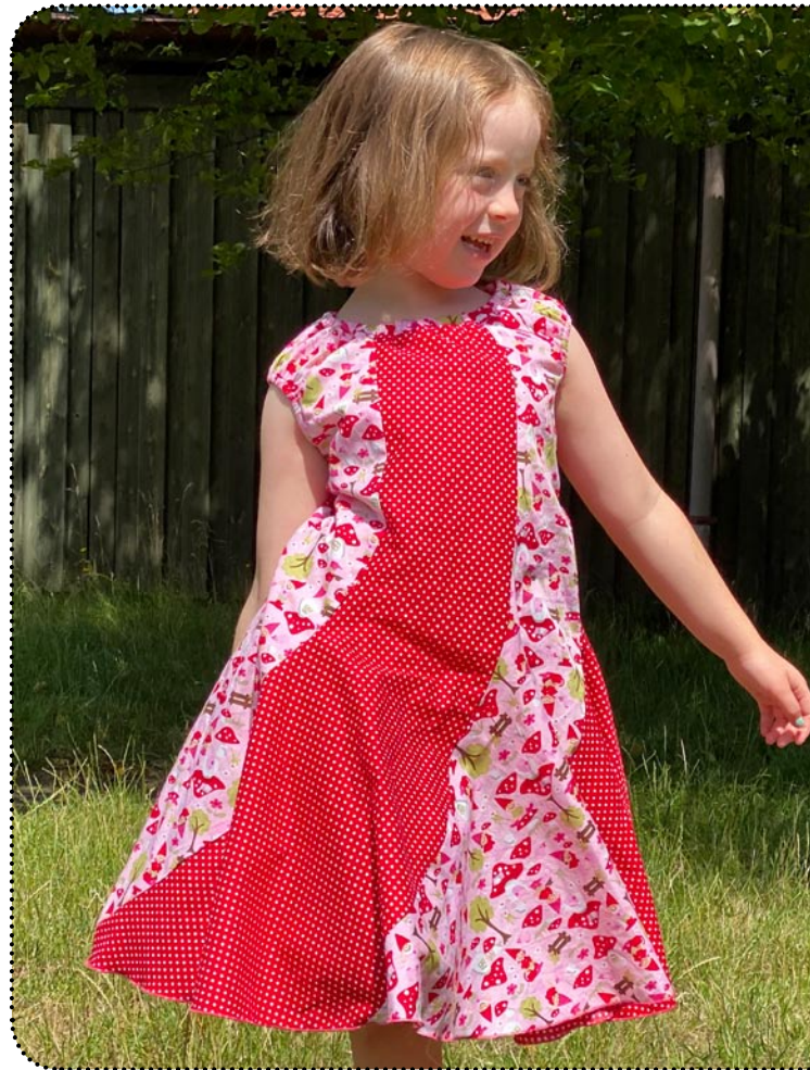
Größe 116 - Weite 104, Jersey/Webware