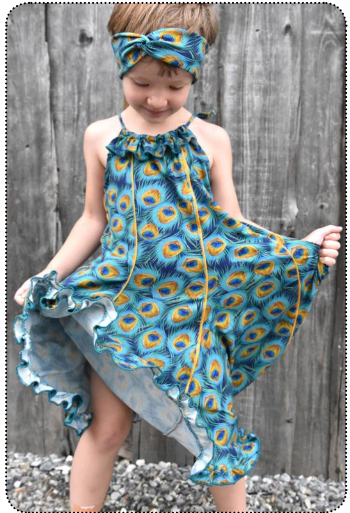
Miss Holliday Drehkleid mit Rüsche

©2020 by Kits 4 Kids e.U. Huber Tina, www.kits4kids.at