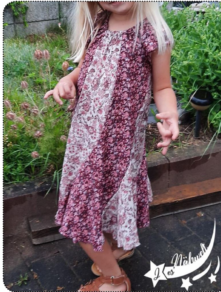
Größe 110 gekürzt, Webware (Viskose)