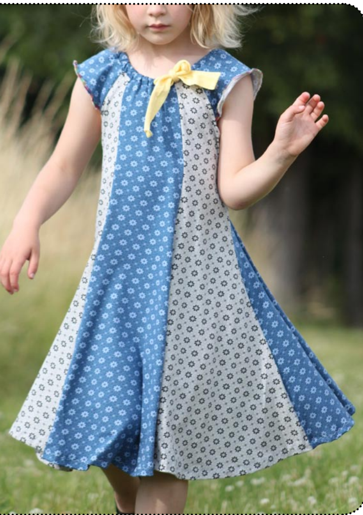
Größe 116 Jersey