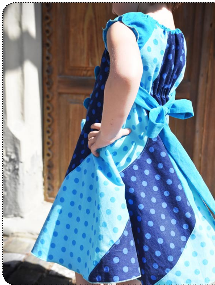
Größe 104, Webware (Feincord)