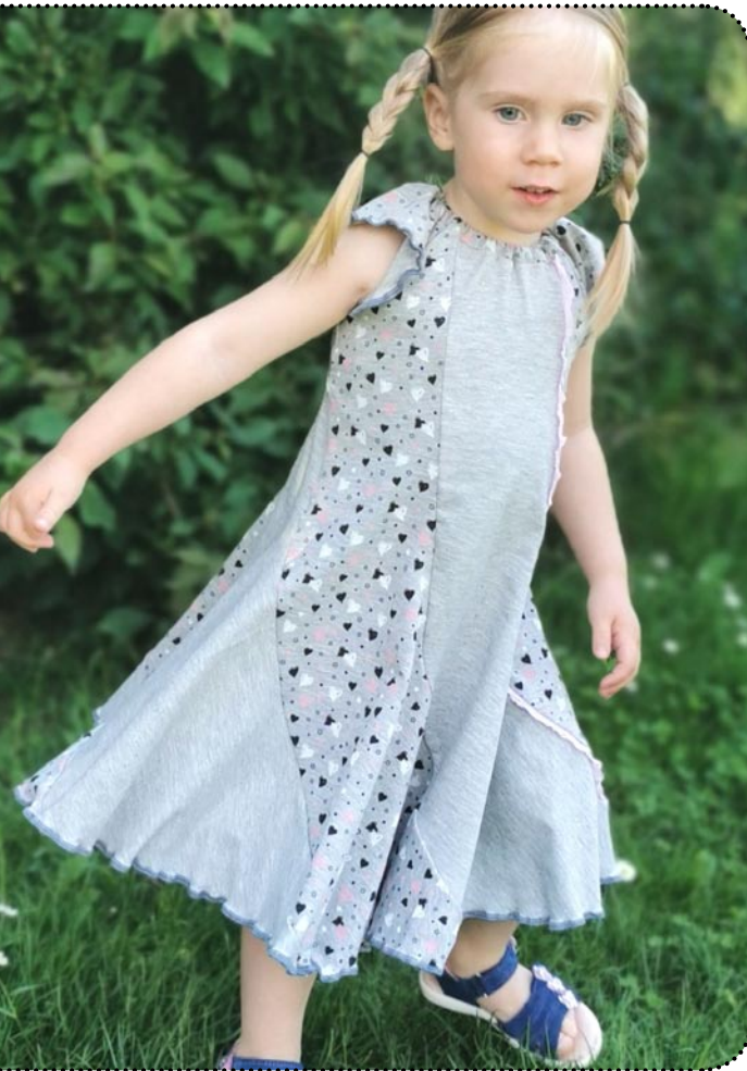
Größe 98, Jersey