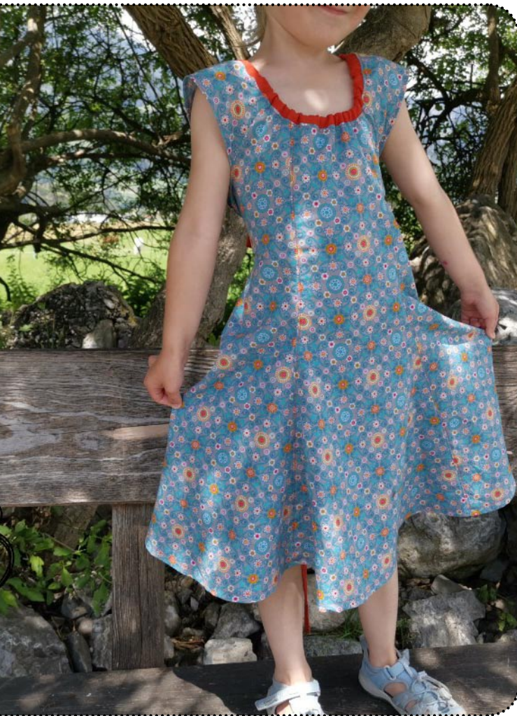
Größe 104 - Weite 86, Webware