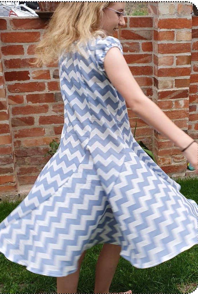
Größe 146, Webware