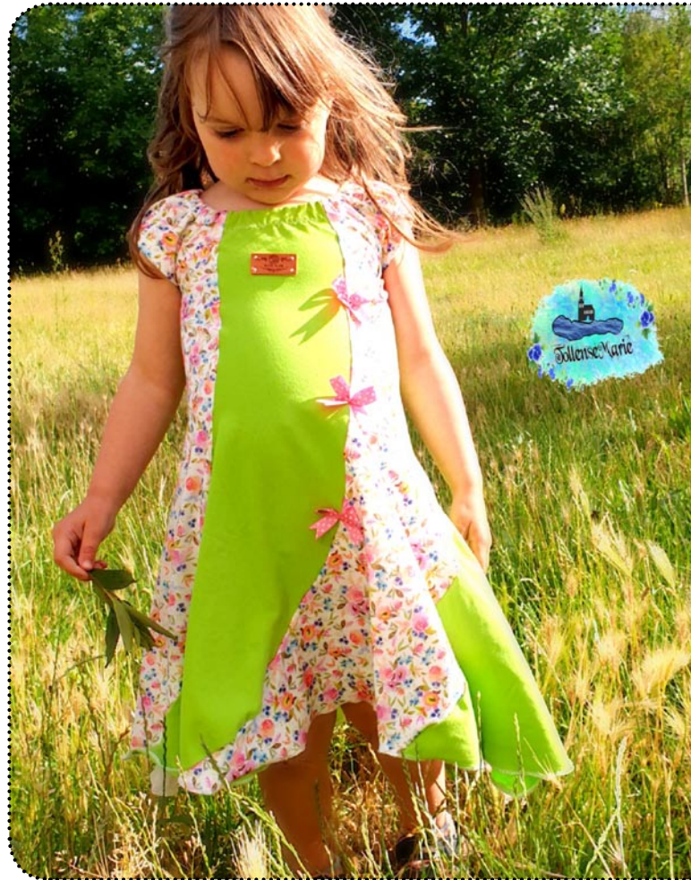
Größe 98, Jersey