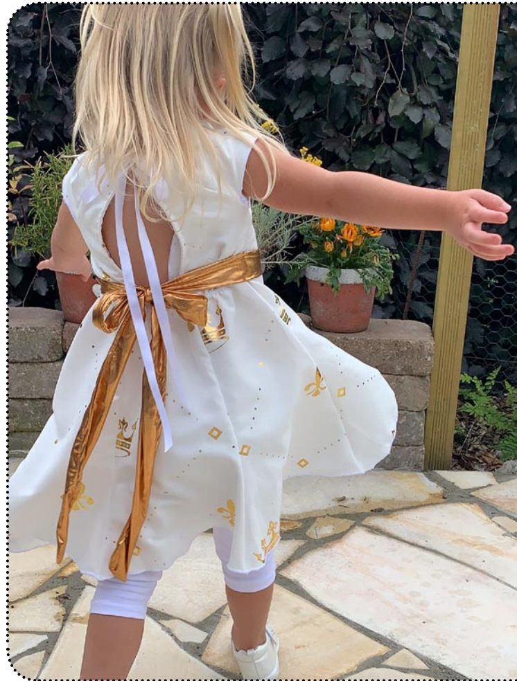
Größe 98 gekürzt, Webware