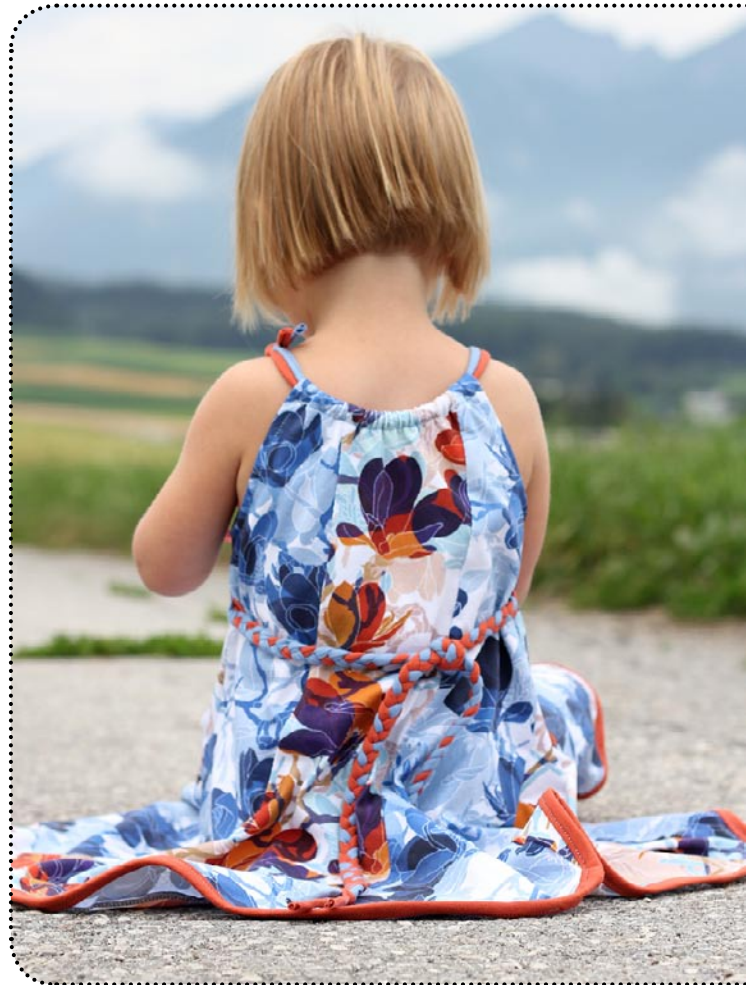
Miss Holliday - Größe 86 gekürzt, Jersey