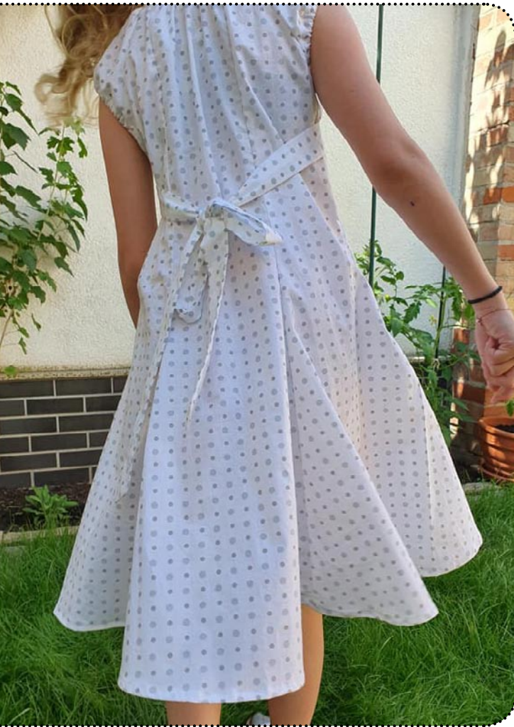
Größe 146, Webware