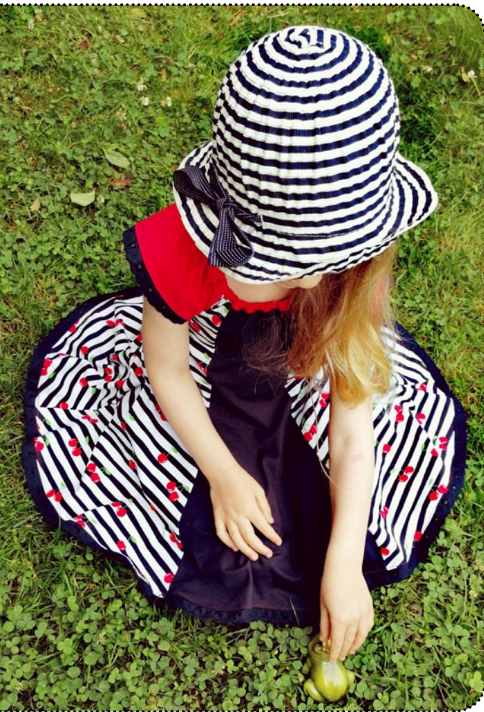
Größe 110 gekürzt, Jersey