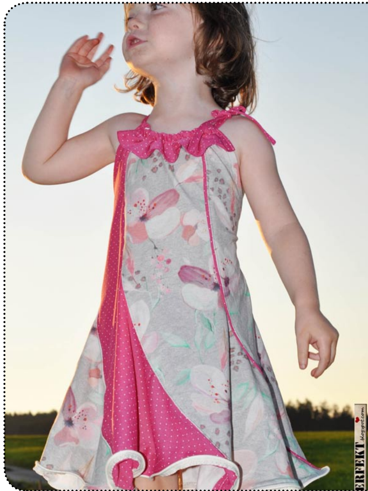
Miss Holliday - Größe 98 gekürzt, Jersey