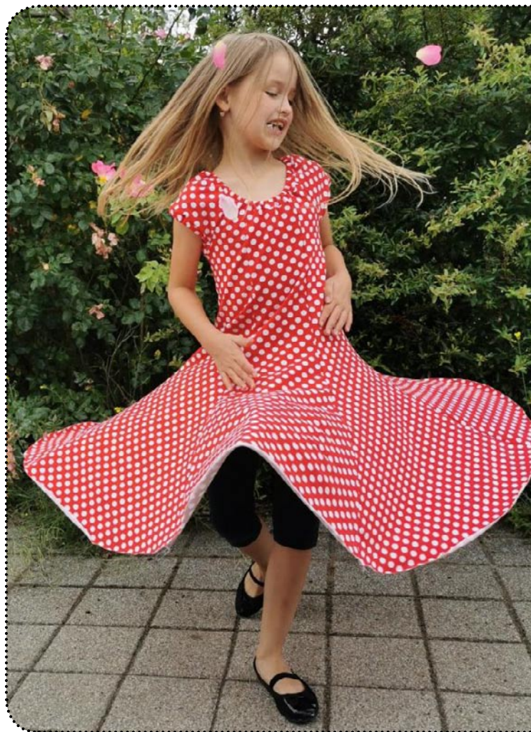
Größe 128 - Weite 116, Jersey Größe 122, Webware