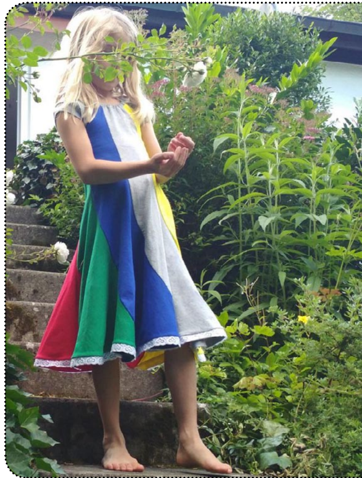
Größe 98 und 122, Jersey