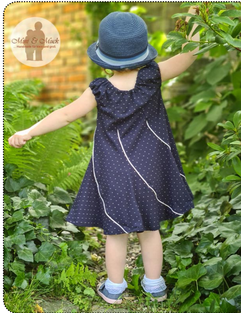
Größe 86, Jersey