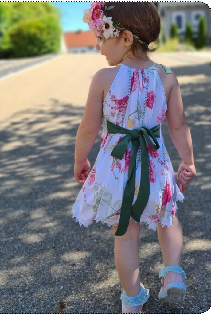
Miss Holliday - Größe 86 gekürzt, Jersey