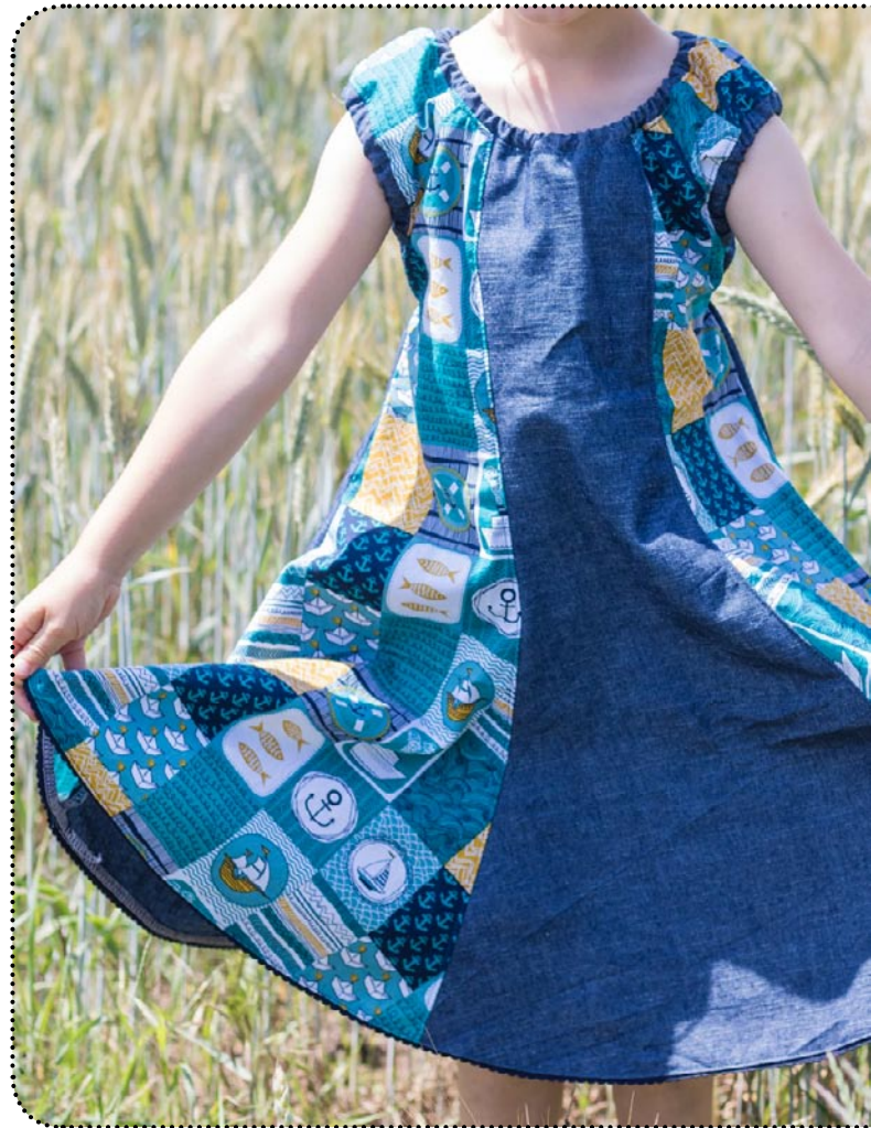
Größe 116, Webware