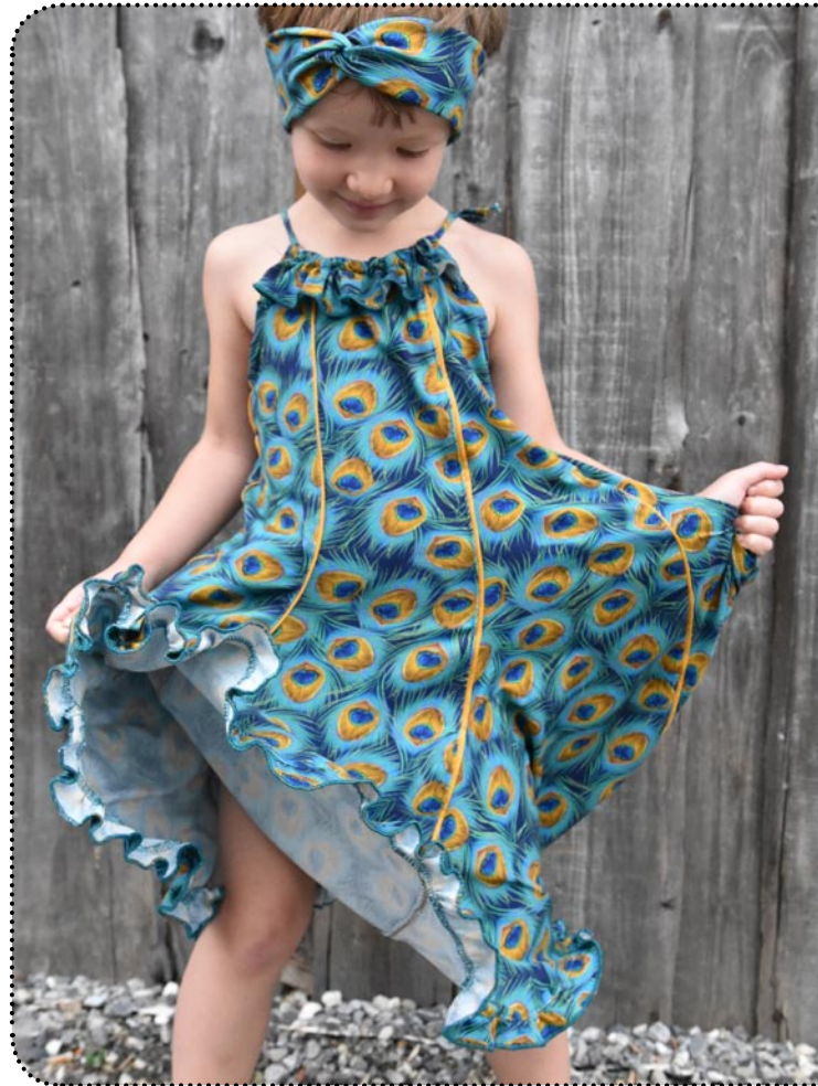
Miss Holliday - Größe 110, Jersey